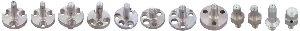
ERF0101 ERF0103 ERF0104T ERF0107 ERF0110 ERF0112 ERF0102 ERF0104 ERF0105 ERF0108 ERF0111 ERF0113